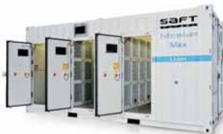
▲ Intensium® Max

Los sistemas de almacenamiento de energía a nivel de megavatio de Litio lón Intensium® Max de Saft pueden implementarse como parte de sistemas regenerativos a lo largo de la vía para captar la energía de frenado y reutilizarla durante la aceleración. El sistema compartimentado completamente integrado cumple un doble objetivo: ahorro energético y respaldo al aumento de la estabilidad de la red a través de la asistencia en la frecuencia. También permite generar ingresos adicionales al posibilitar que los operadores vendan la energía de reserva sobrante reintegrándola a la red eléctrica local.