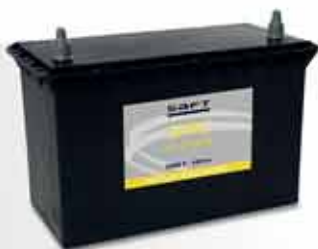
▲ Condensador de níquel de Saft (SNC)