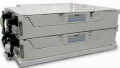
▲ Sistema de baterías lon-Board® Regen

lon-Board® Regen suministra alta potencia y energía desde una sola fuente, lo que se traduce en una mayor eficiencia energética. Las baterías constan de bloques de baterías e incluyen un sistema de gestión a fin de obtener una solución modular y de fácil integración que se suministra en sus propias carcasas aptas para aplicaciones ferroviarias.