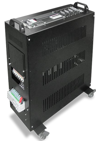
Versión portable con ruedas y asas