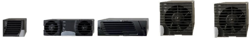
Módulo rectificador DPR850-48 DPR1600-48 DPR2900-48 DPR3500-24 DPR4000-48