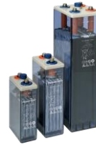
Baterías plomo placa tubular