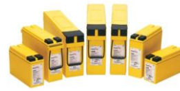
Baterías plomo AGM VRLA

El RAF Telecom se suministra asociado a cualquier tipo de batería estacionaria. La configuración personalizada para cada batería puede ser realizada por Recticur en fábrica o bien puede realizar su configuración a través de su controlador para mayor flexibilidad.