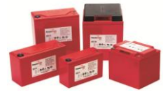
Baterías plomo puro